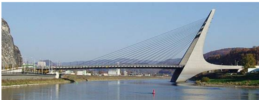
Obrázek 1 – Mariánský most, Ústí nad Labem

(zdroj: https://www.archiweb.cz/n/home/usti-nad-labem-planuje-prodat-mariansky-most )